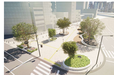
まちなか広場の整備

下記の取扱金融機関にてご購入いただけます。(神戸市役所では販売していません) ご購入の際には、各金融機関によって必要な手続きが異なる場合があります。 口座管理手数料等が必要となる場合がありますので事前に取扱金融機関にご確認ください。